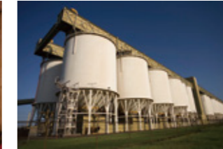
储罐、槽、箱等内部检测